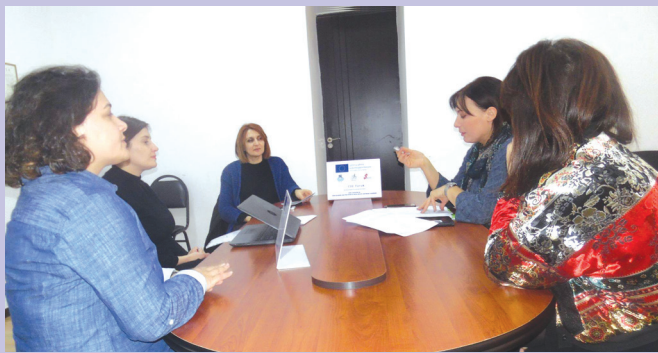
შეხვედრა ბაღდათის მუნიციპალიტეტში