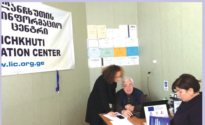
შეხვედრა ლანჩხუთის მუნიციპალიტეტში