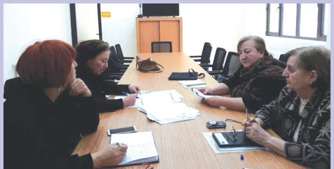
შეხვედრა ცაგერის მუნიციპალიტეტში