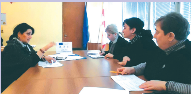
შეხვედრა თერჯოლის მუნიციპალიტეტში