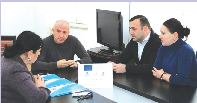
შეხვედრა ხონის მუნიციპალიტეტში