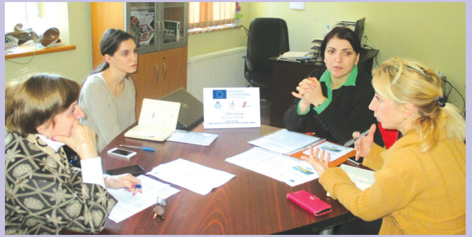
შეხვედრა აგროლუარის მუნიციპალიტეტში