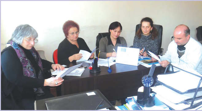
შეხვედრა ვანის მუნიციპალიტეტში